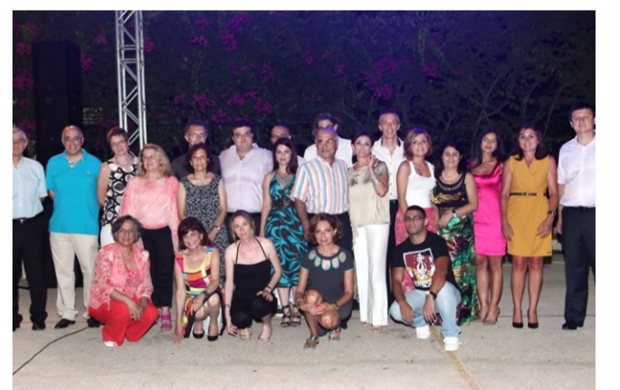
Enseignants et employés du lycée à l'honneur.