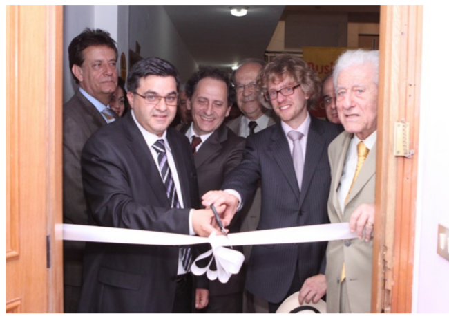
L'ouverture officielle de l'unité, au terme de la cérémonie inaugurale.