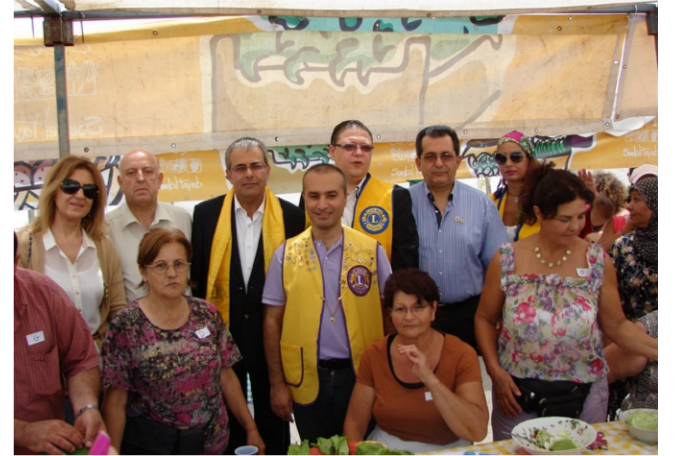
Les participants et le jury pour le concours du meilleur taboulé.