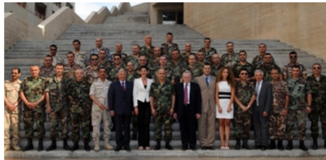
Photo souvenir pour les 40 officiers, sur les escaliers du Campus de l'innovation et du sport.