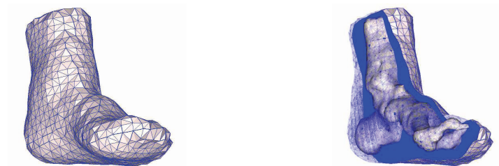
Fig. 1. Modèle biomécanique EF du pied ( gauche ) et vue interne des structures osseuses modélisées ( droite ).

La Méthode des Eléments Finis (MEF) est une technique mathématique permettant de résoudre les systèmes d'Equations aux Dérivées Partielles (EDP) de la biomécanique sur un domaine tridimensionnel de forme quelconque comprenant des régions anatomiques caractérisées par des comportements mécaniques distincts. La MEF s'appuie sur une représentation discrétisée de l'organe modélisé, appelée « maillage », composée de briques élémentaires, ou « éléments » définis par des points appelés « nœuds du maillage ». Un maillage EF est donc un ensemble de nœuds connectés entre eux par des éléments.